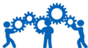
Treball en Equip