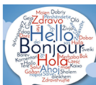
Impuls de les Llengües Estrangeres