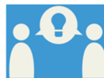
Aprenentatge Globalitzat i Cooperatiu