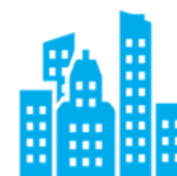
Compromís amb la Societat