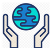
Compromís amb el Medi Ambient