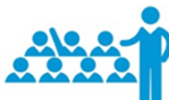
Foment de la Participació