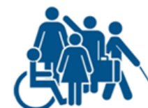
Inclusivitat, Pluralitat i Coeducació