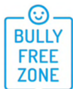
Tolerància Zero enfront l'assetjament